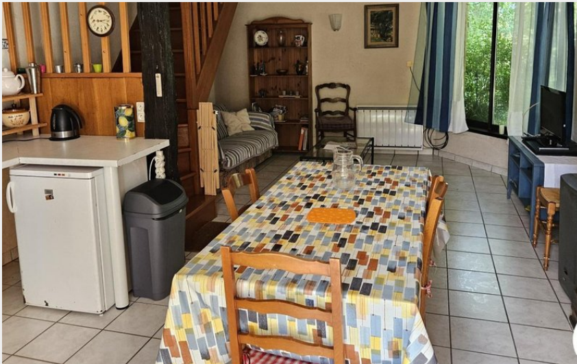
Les Figuiers - Taïx - Gîtes de France - salon de jardin - pièce à vivre