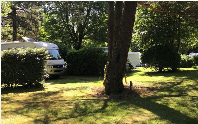
Crédit : Camping de la Rigole emplacements ombragés (Camping de la Rigole)