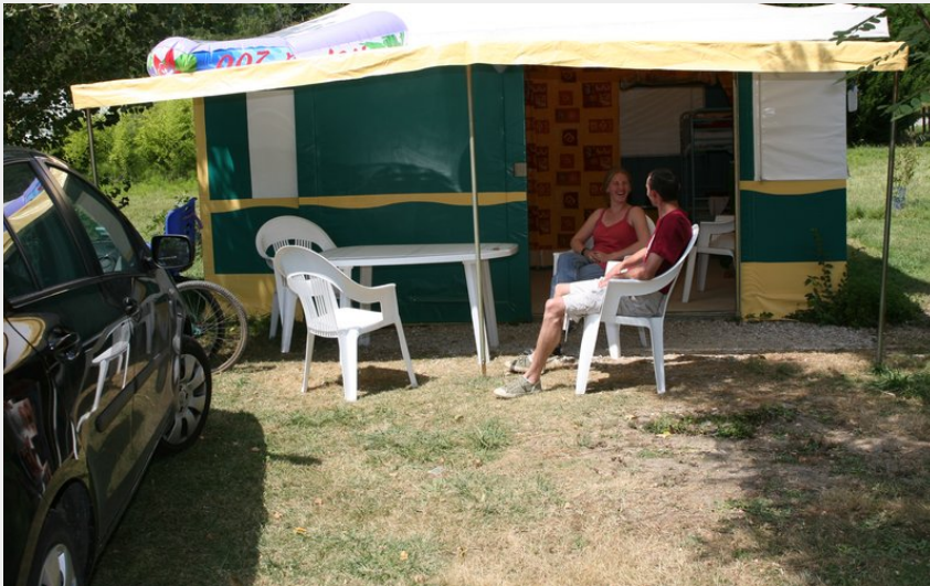
Crédit : Plan d'Eau St Charles bungalow toilé (Plan d'Eau St Charles)