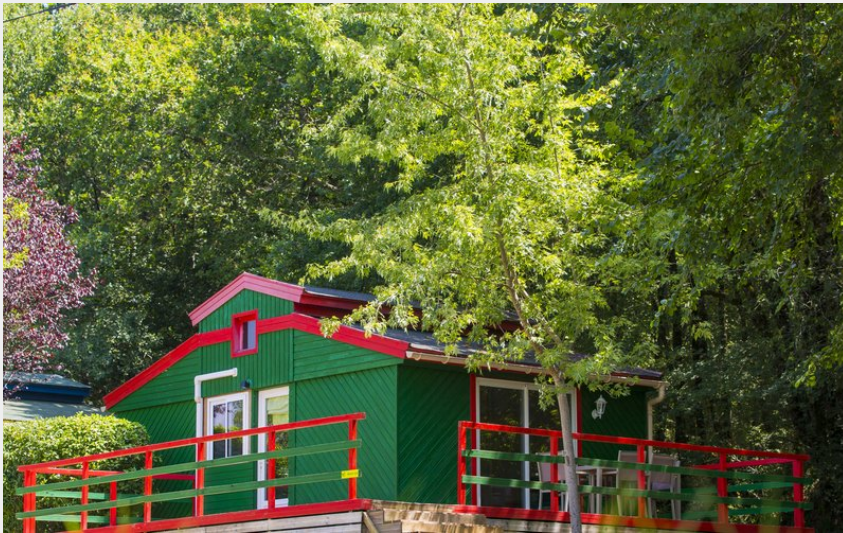
Chalet bois (Saint Pierre de Rousieux)