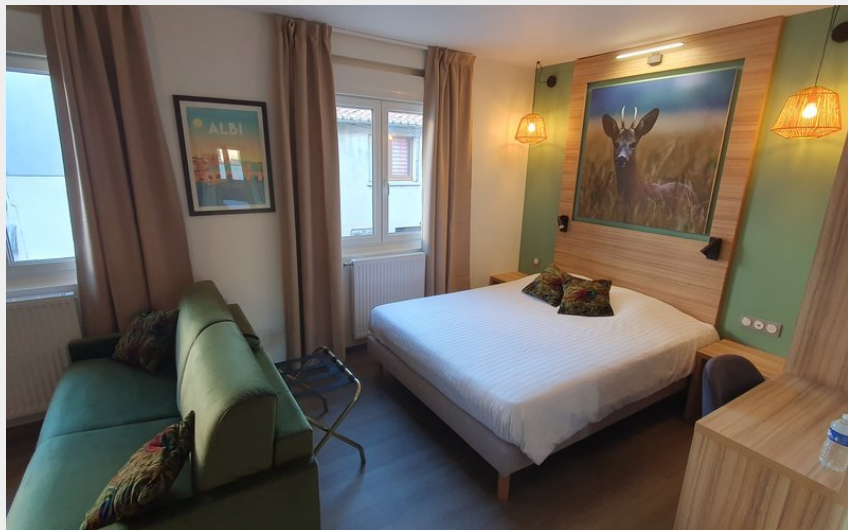
Crédit : chambre (J.Monteil-Hôtel-Restaurant Les Pasteliers_Lavaur)