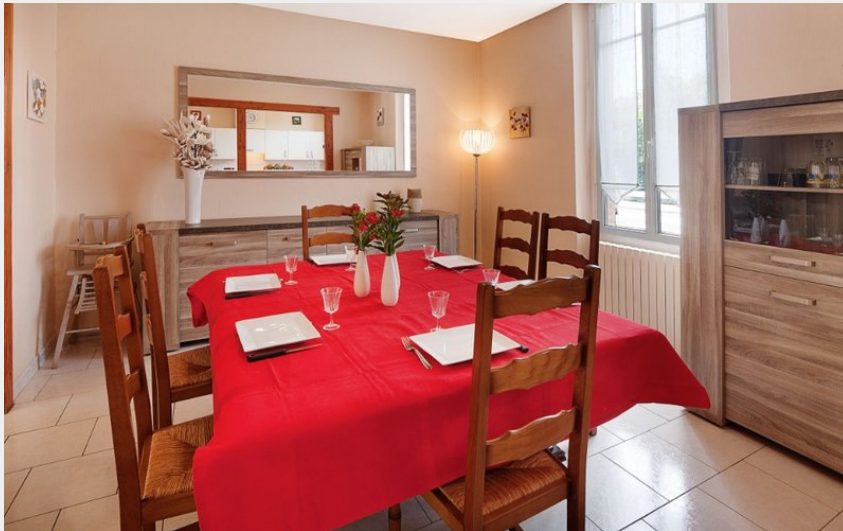
Gîte Clévacances Laoisier Tarn Midi Pyrénées - Sud Ouest - salle à manger