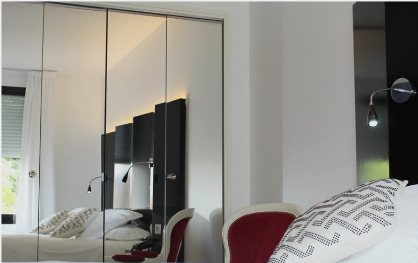
Crédit photo : Chambre Hotel Saint Antoine Albi (Hotel Saint Antoine Albi)