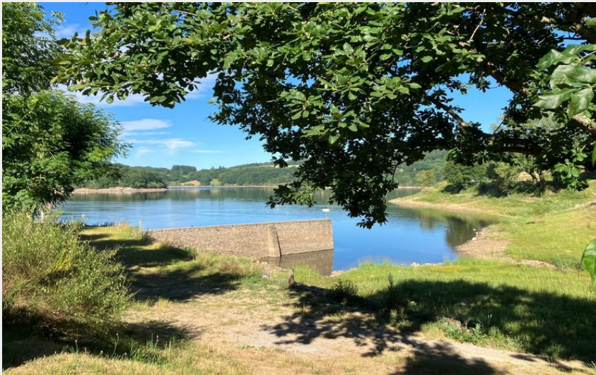
Crédit photo : Aire Natruelle des Rives du Laouzas vue lac (Rives du Lac)