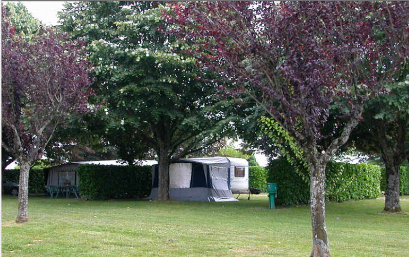
Crédit photo : Alban La Franquèze Emplacements ombragés (Alban La Franquèze)