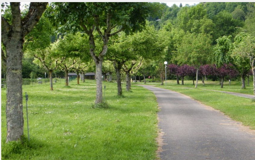
mplacements ombragés (Municipal la Rabaudié)