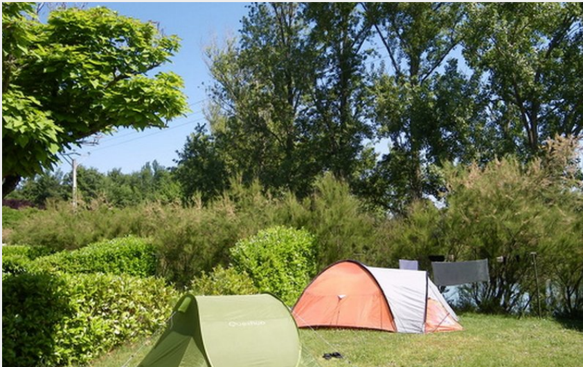
Crédit : Camping Municipal Les Auzerals emplacements tentes (Camping Municipal Les Auzerals)