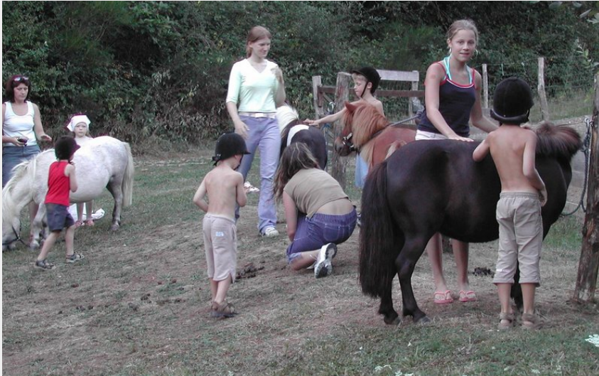
Crédit photo : La Bastide d'Albignac ânes & enfants (La Bastide d'Albignac)