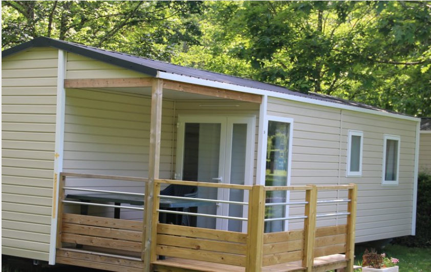
Crédit photo : Camping Municipal La Bâtisse mobile home 3 chambres (Camping Municipal La Bâtisse)