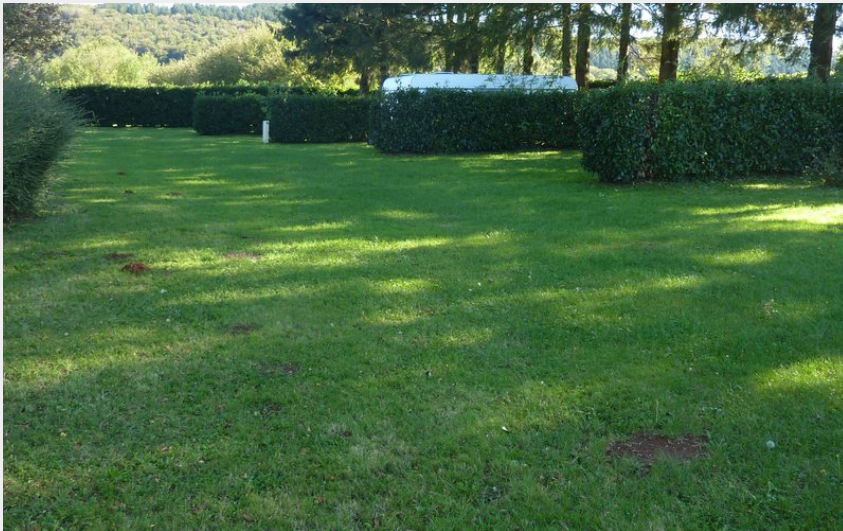
Crédit : Camping Municipal Arfons emplacements (Camping Municipal Arfons)