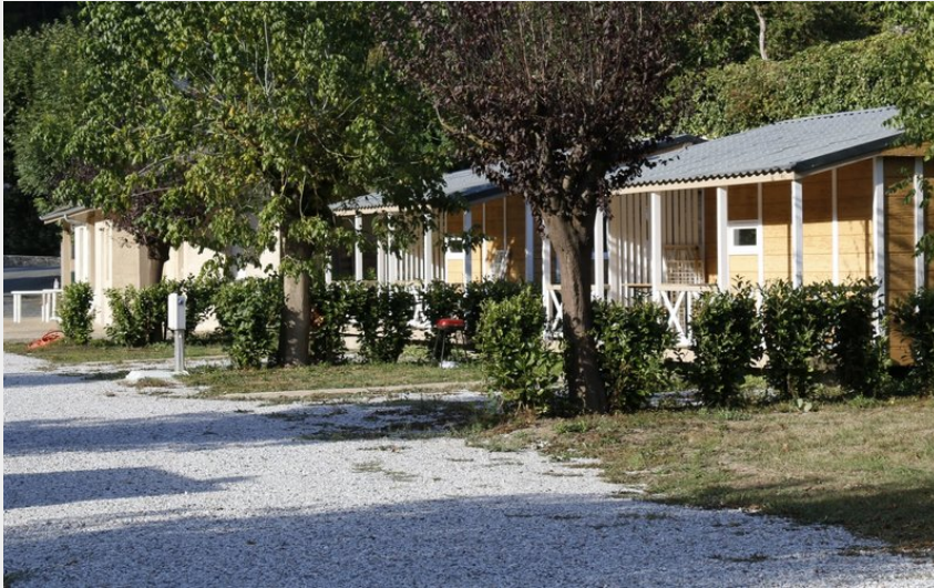
Crédit photo : Camping Le Jardin emplacements et locations (Camping Le Jardin)