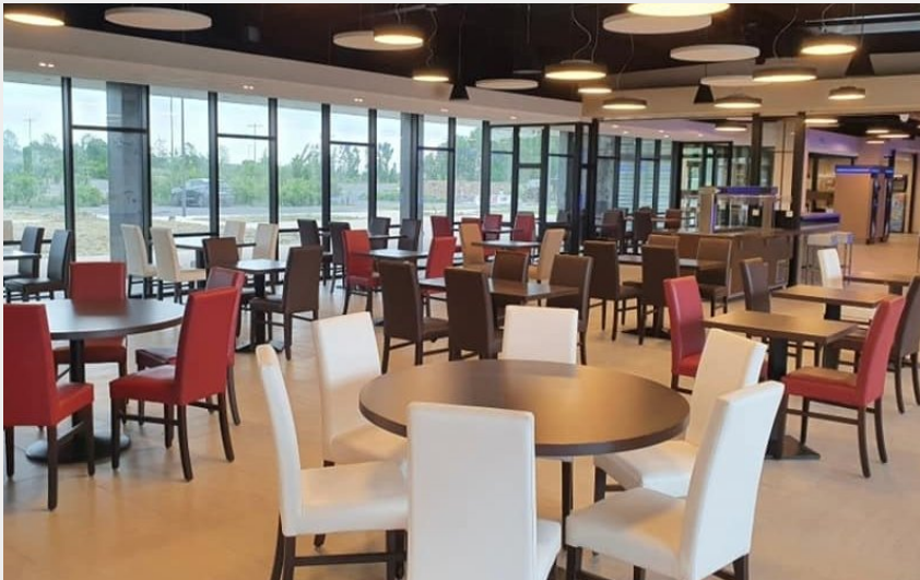
Crédit : salle restaurant