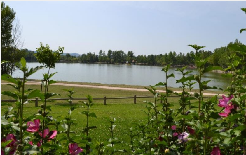
Espace de loisirs (CD81)