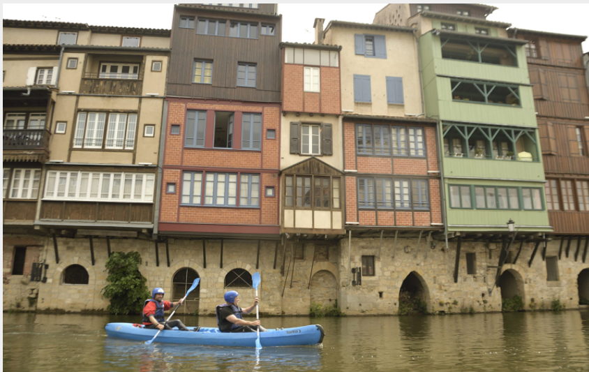
devant les maisons sur l'Agout (Ville de Castres)