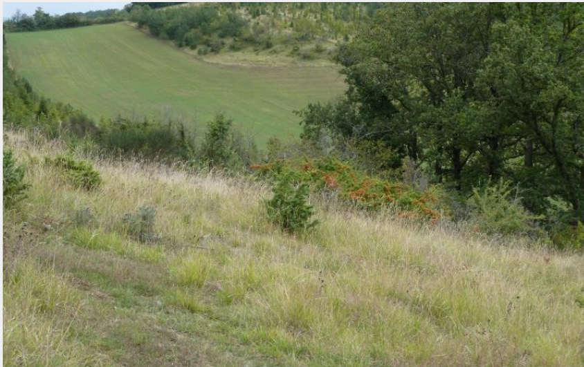
Coteau sec (CD81)