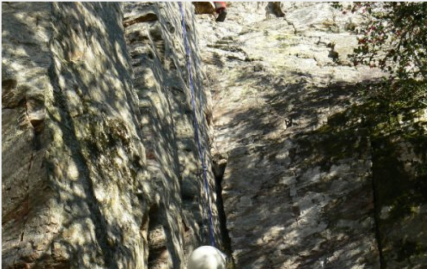
Escalade Mont-Roc (CD81)