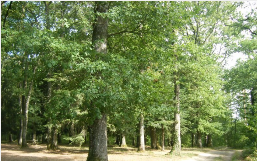
Forêt de Sivens (CD81)