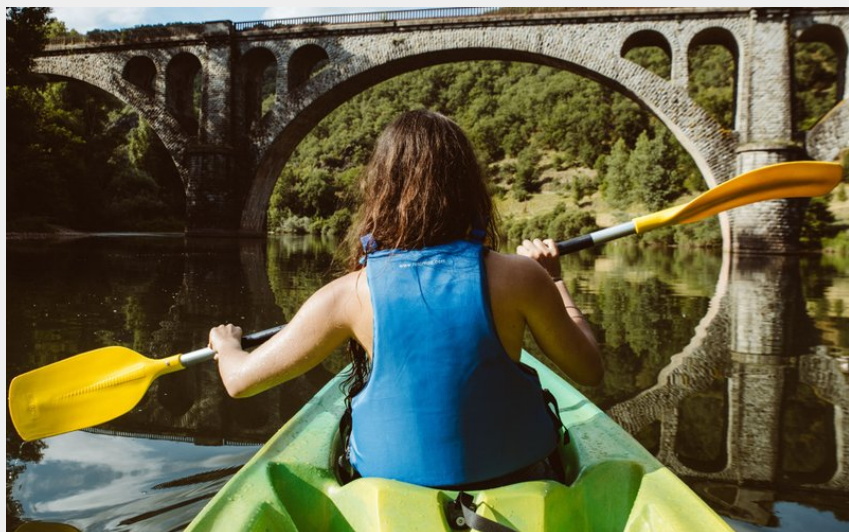
Canoë vallée du Tarn